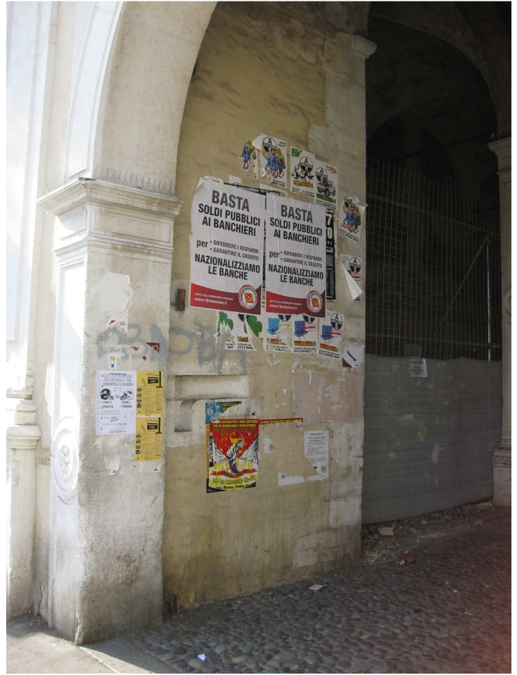
L'ingresso alla Porta nel 2009...

La realizzazione della piazza integrata alla Porta, prevista dal Contratto di Quartiere ma non finanziata, creerebbe un centro di attrazione per attività commerciali, per eventi culturali e come luogo di incontro dei residenti e degli studenti.